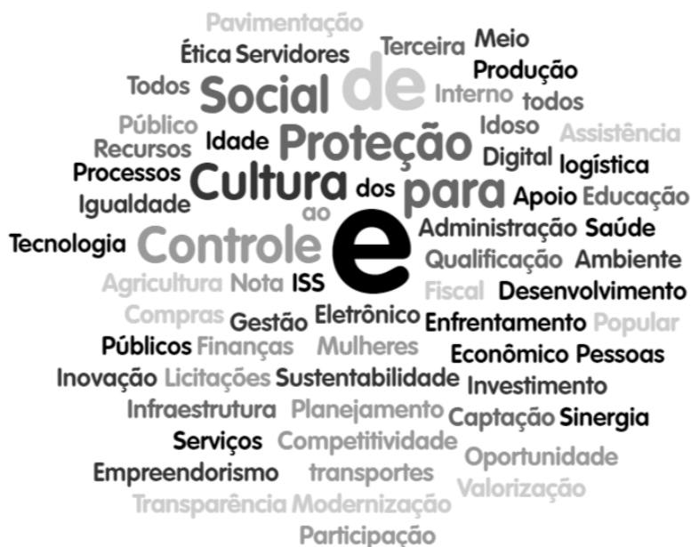
Figura 2 Chuva de Palavras (Tag Cloud)

O plano de governo do candidato a prefeito de Mâncio Lima está pautado em valores essenciais na gestão pública que trarão resultados concretos, traduzidos na tag cloud 2 descrito na figura 3.